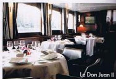
Le Don Juan II

Visitez la Boudeuse Après un tour du monde de trois ans, la Boudeuse, trois mâts-goélette en acier, s'est amarré jusqu'en septembre au port de Paris (12 e ) et accueille les visiteurs (inscription sur : la-boudeuse.org ). Entrée gratuite, avec contribution volontaire pour financer la prochaine expédition.